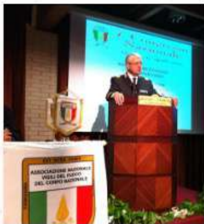
logistica, att. sussidiarie

L'ANVVF si è dotata di un ufficio per la gestione dei Grandi Eventi, questo segmento operativo fa capo all'Ufficio di Presidenza, organizza e realizza le attività su tutto il territorio nazionale servendosi di componenti l'ufficio di presidenza e di nostri soci che vengono scelti in base al distretto interessato e alle loro competenze.