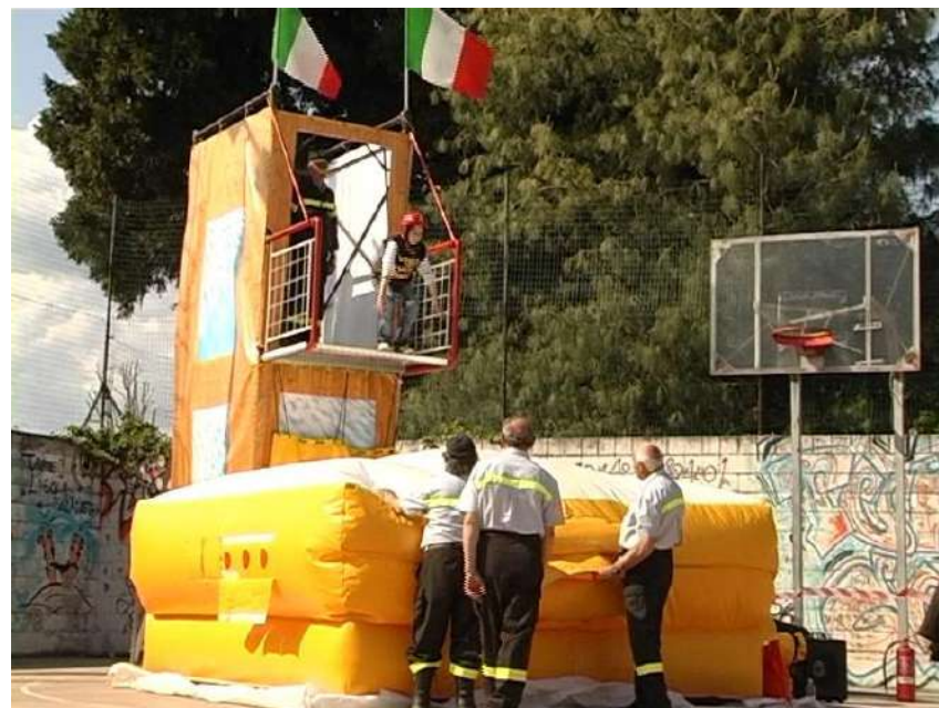
POMPIEROPOLI – Percorso ludico professionale rivolto ai più piccoli