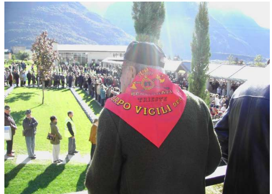
Vajont – 45° Manifestazione Commemorativa del VAJONT