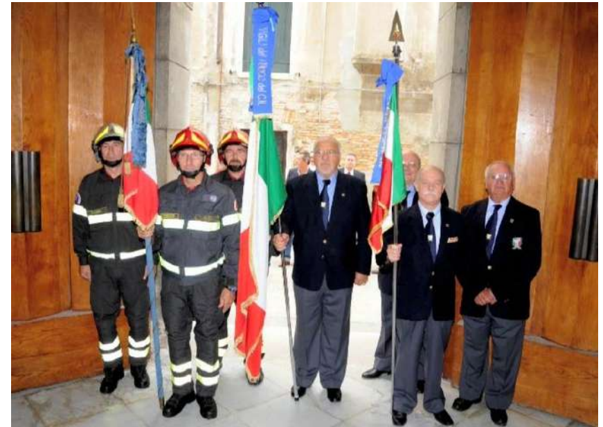
XVI Raduno Nazionale di Venezia, 26 Settembre 2009