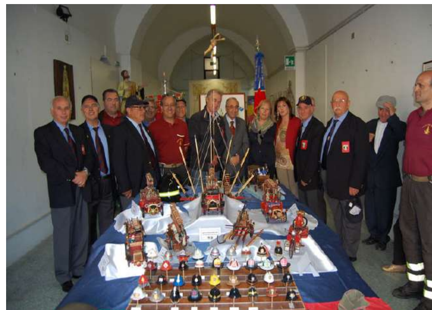
Sezione di MATERA e la Lega Italiana per la Lotta contro i Tumori (LILT) – Giornata Mondiale senza Tabacco