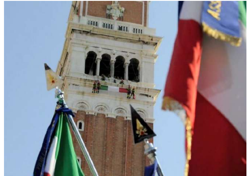
XVI Raduno Nazionale di Venezia, 26 Settembre 2009