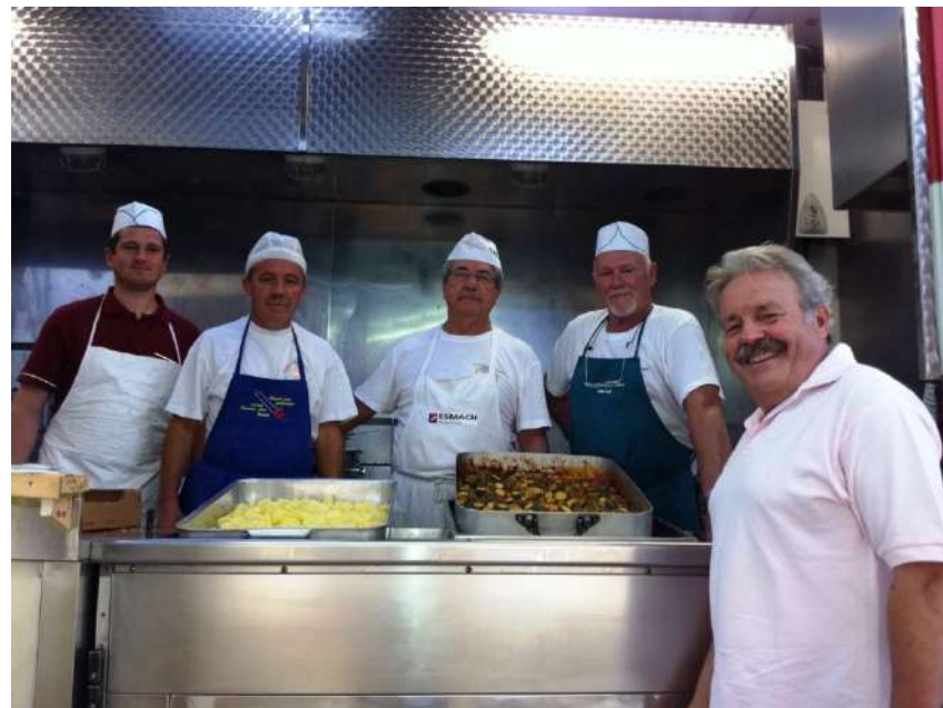
Terremoto Emilia Romagna gestione logistica/mensa presso il C.O.A. Veneto di Ferrara